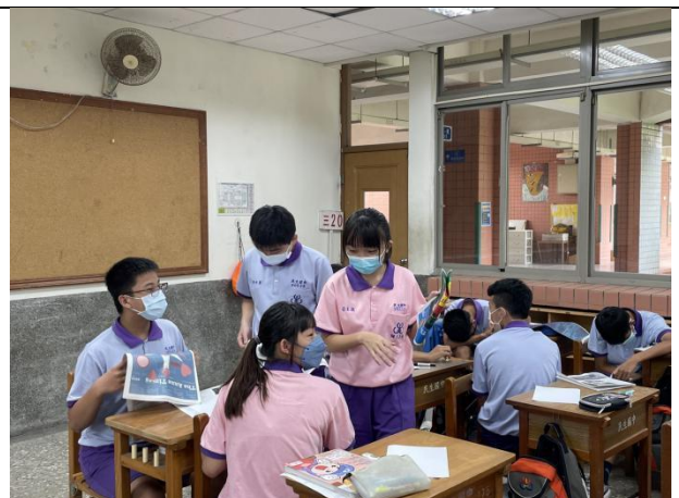
閱讀並進行版面架構討論