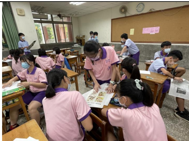
嘗試進行小組版面分析