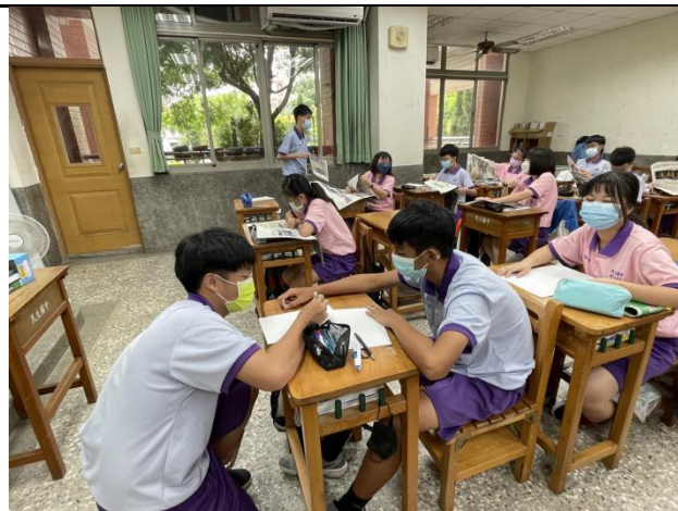
討論應用可展現的主題