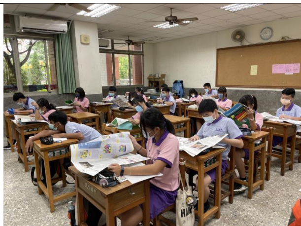
讀報，認識操作方式與材料