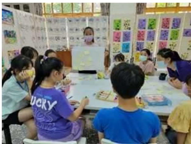
A -3 「為我們的環境策展」--破「境」重「原」課程實施照片：