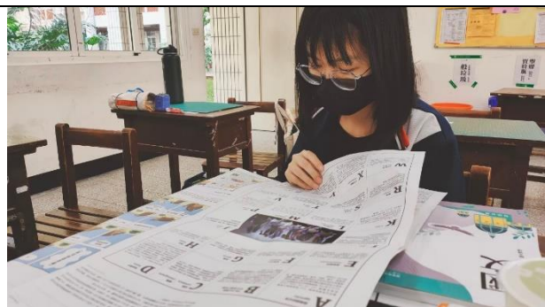
▲學生閱讀美感刊物，安妮新聞