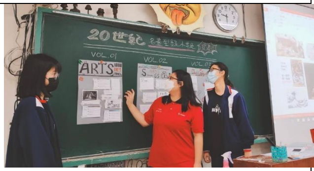
▲上台分享導讀小報