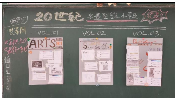
▲各組導讀小報呈現