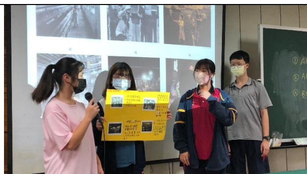
▲攝影主題「你看見了什麼？」分享