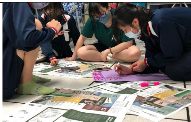
▲圖文編排，美編與統整力的練習