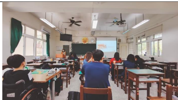
▲課程引導，名畫感受訪問