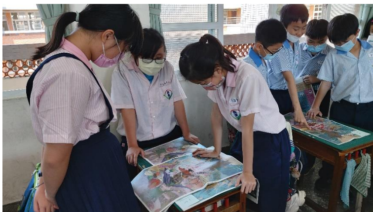
小組封面故事分享