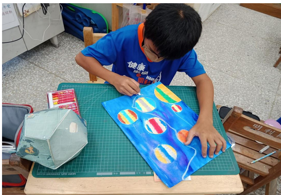
上圖：專注的學生，畫著自己的宇宙航行人的遊記，這就是一幅美麗的畫。