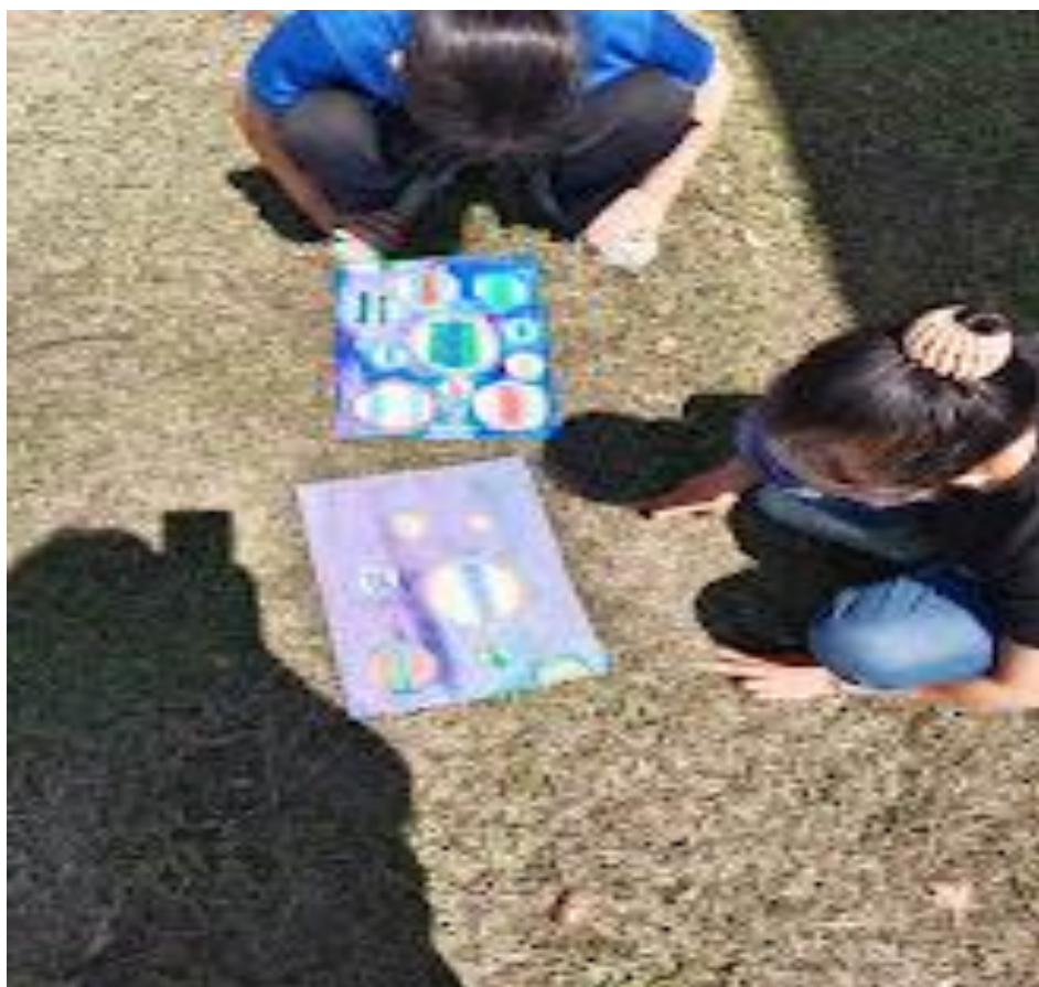
上圖：學生喜歡畫水彩畫，當天艷陽高照，畫好水彩後可以在戶外曬太陽，畫跟人都可以一起在陽光下，曬著暖暖的陽光，我們都覺得好舒服。