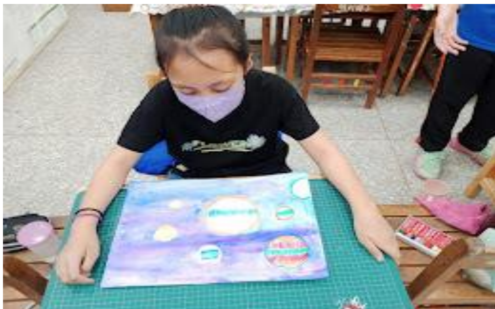
(學生學習回饋當自己畫出作品後覺得好開心)