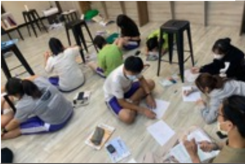
A 課程實施照片 (請提供5-8張) :