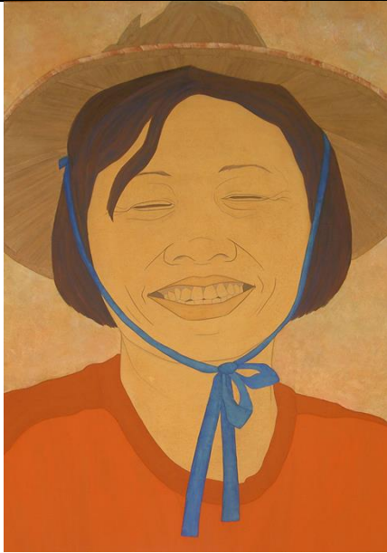
鍾舜文 《燦》 2005 / 其他地區 藝術家自藏 / 藝術作品 Artwork / 人物靜物 Still Life / 膠彩類 Colloid Painting 膠彩、棉紙 154.5 × 108 cm