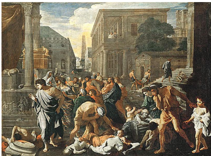
《阿什杜德的瘟疫》尼古拉·普桑