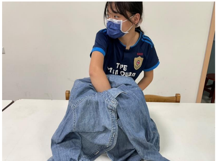
↑ 學生進行「神秘箱」試探活動