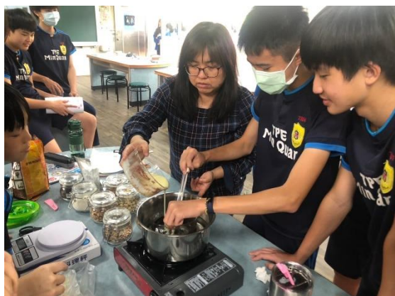
←巧克力膏及食材準備