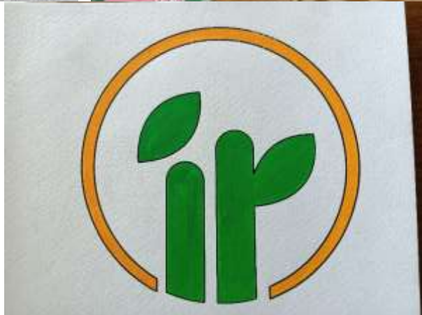
色彩三屬性色調混色練習