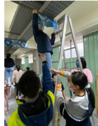
▲結合實際環境，在施工中的學校走廊佈置藍染及海報作品展覽