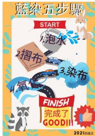
▲以線上軟體 Canva 設計的藍染主題海報