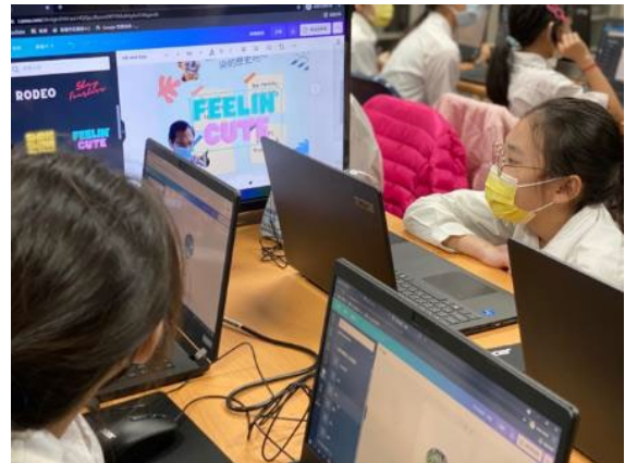
▲科技課學習線上軟體