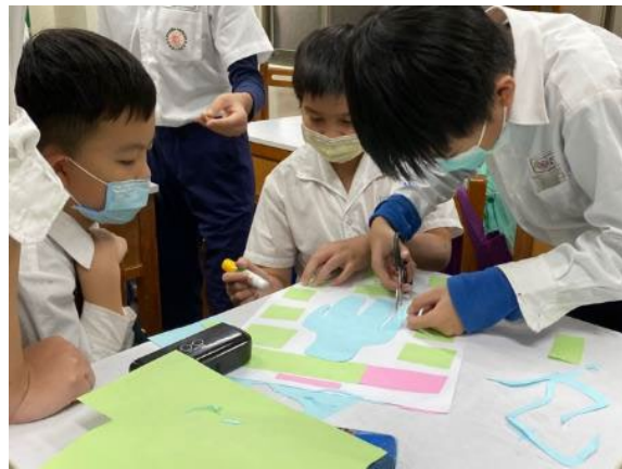
▲專案小組進行圖文編排分析