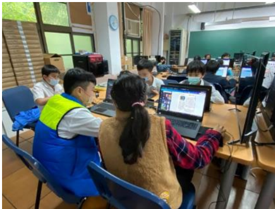
▲線上軟體 Canva 實作