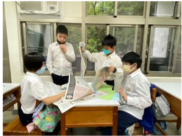
▲專案小組討論選擇喜歡的圖文編排