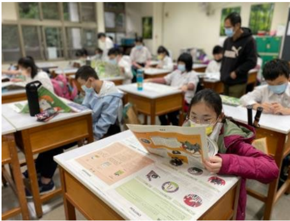
▲安妮新聞自由閱讀