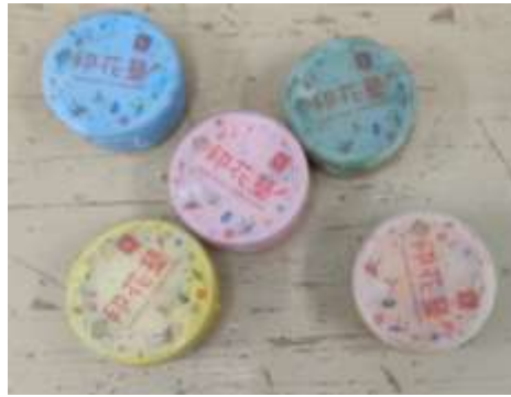
■ 使用的顏料為印花樂絹印顏料(也可繪製用) ■