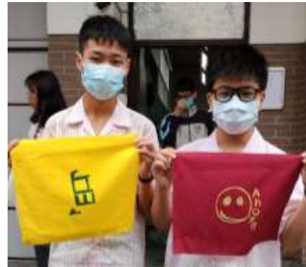
■ 附加課程-型版絹印 ■