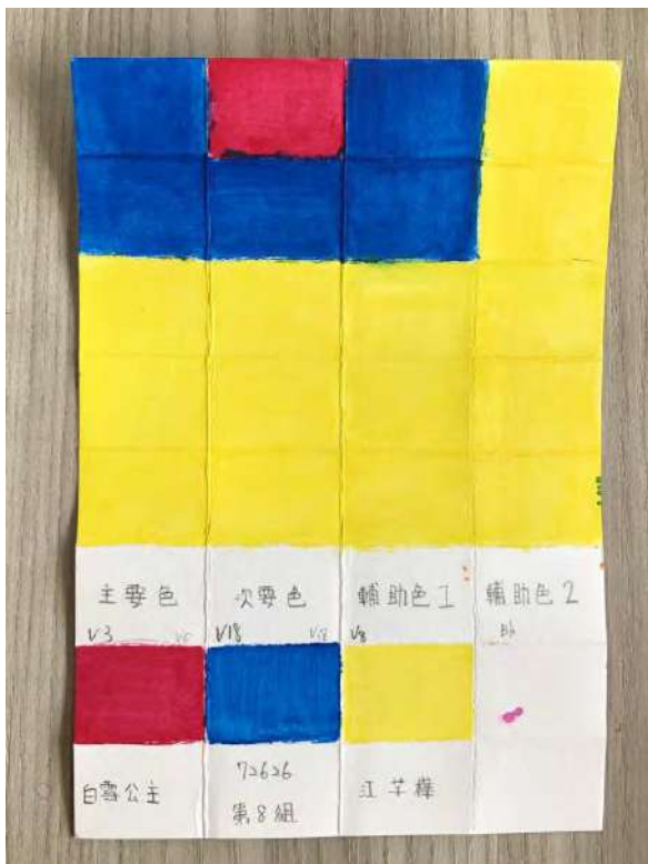
動畫角色分色練習—白雪公主