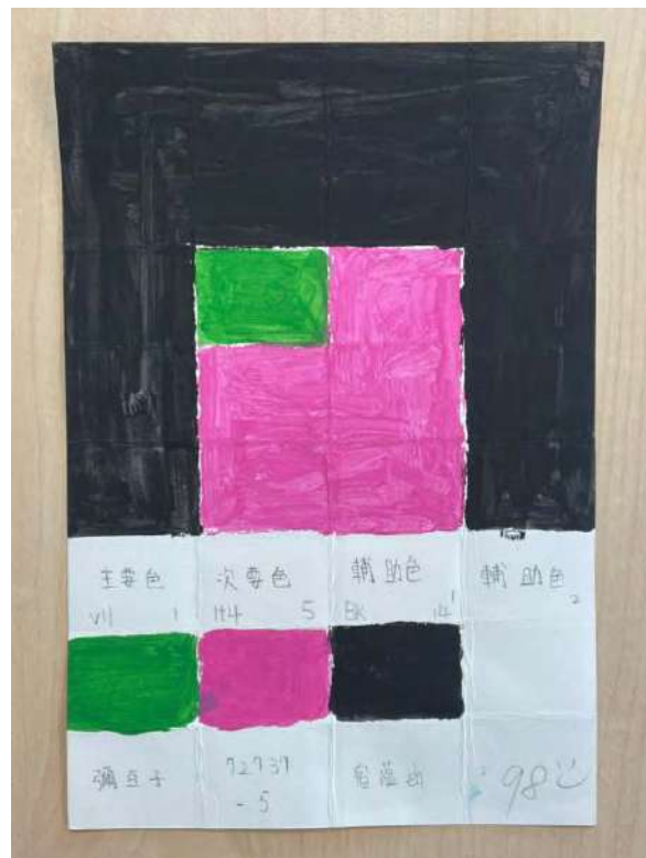
動畫角色分色練習—彌豆子