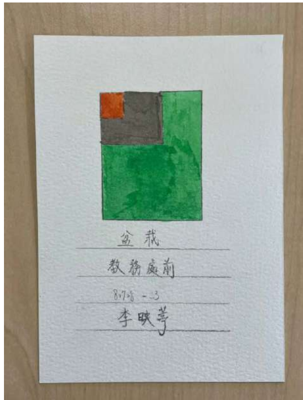
校園速寫分色練習