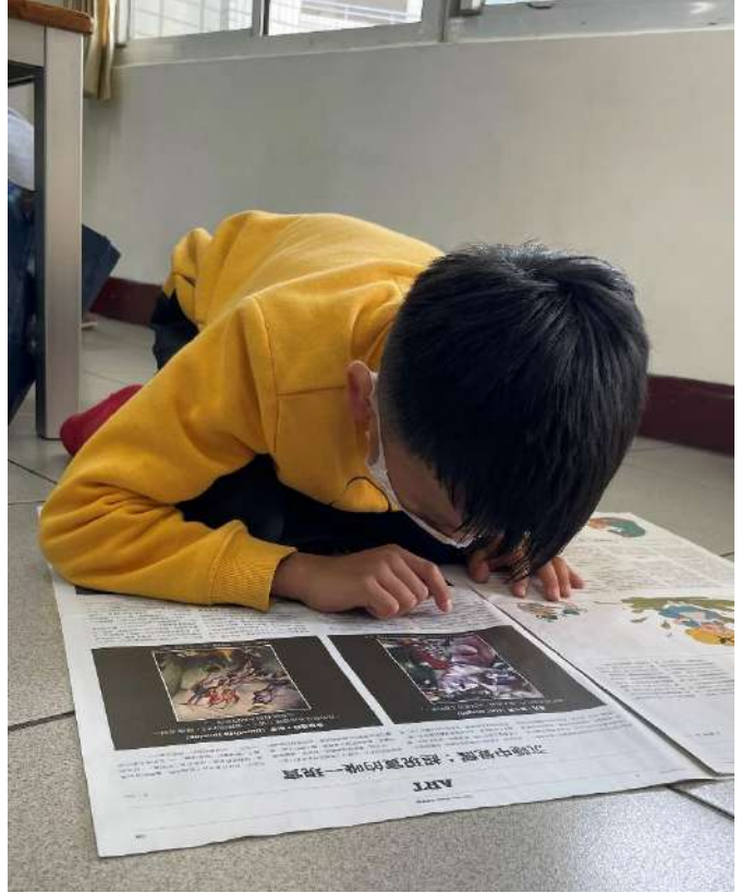
創作自己的情緒小怪獸(多元媒材)