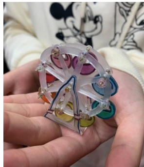
增加許多機關的作品