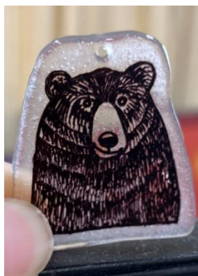
烤過頭，空白處有氣泡