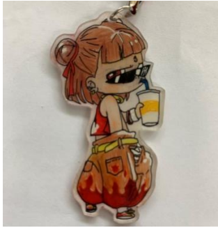
複合媒材(使用色鉛筆+油性筆+馬克筆+立可白)