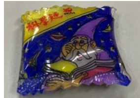
色鉛+油性筆+雙面繪畫