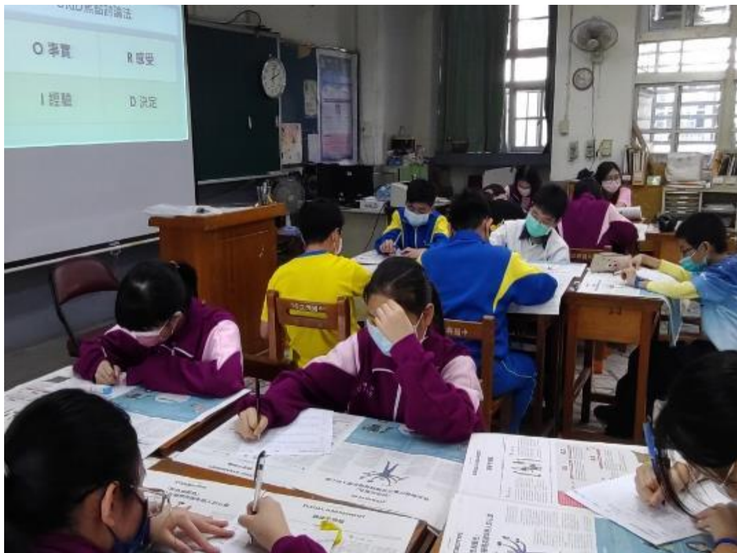
利用 ORID 焦點討論法