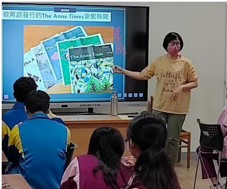
跟學生介紹安妮新聞報