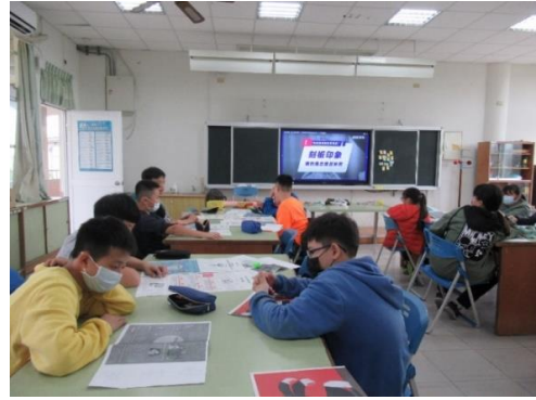
觀看媒體識讀的影片