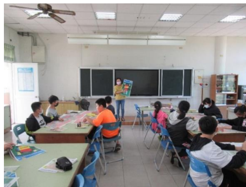
從封面設計、顏色等角度，發表感想