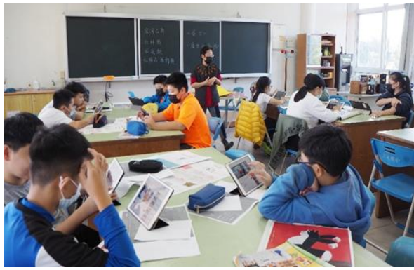
以平板搜尋市面上日用品相關廣告