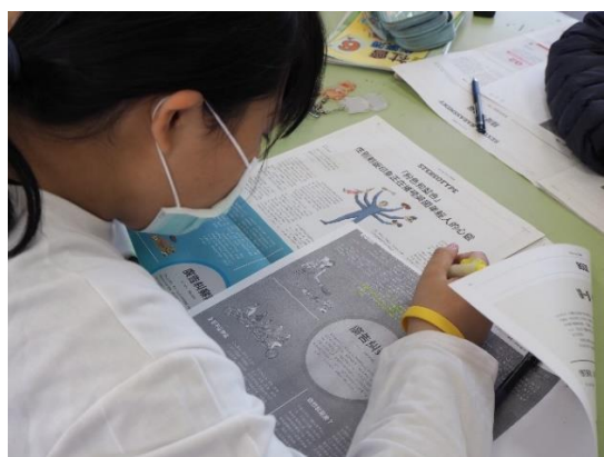
以螢光筆輔助，找出【廣告糾察隊】文章中關鍵字