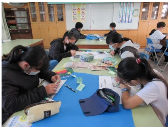
找出【用垃圾蓋學校-一次一個塑膠磚】文章中關鍵字