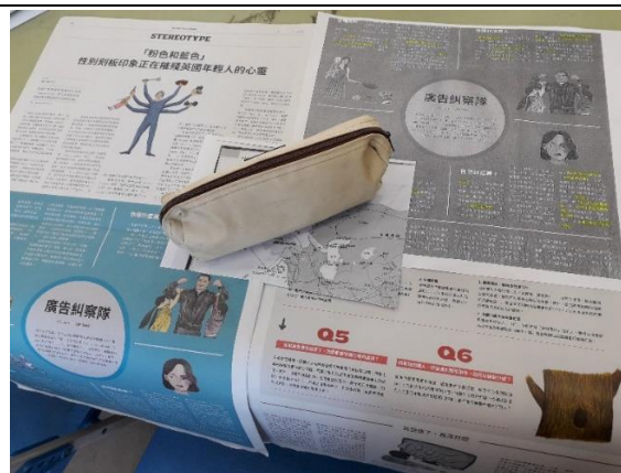
考慮到資源永續及實地操作便利性，將文章影印放大供學生使用