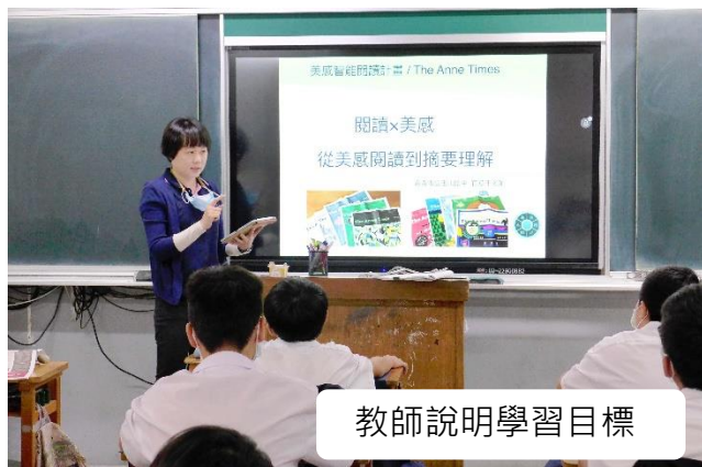
教師說明學習目標