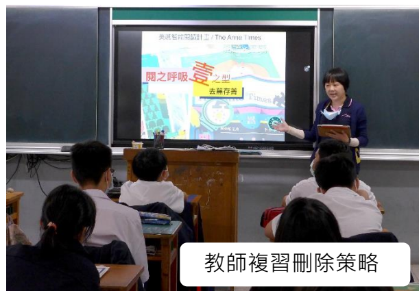
教師複習刪除策略