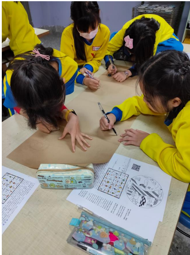
穿越時空來趟古埃及之旅