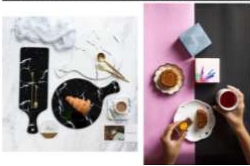
商品攝影-聚焦單一商品俯視(搭配底色)