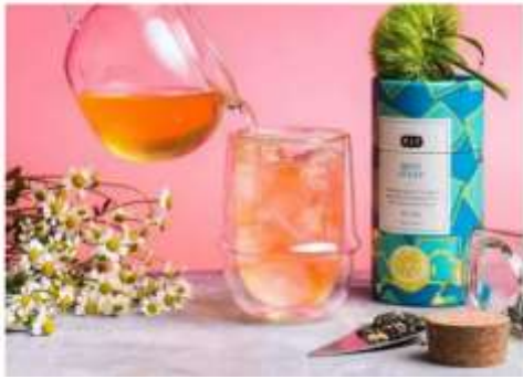
商品攝影-聚焦單一商品平視(搭配色彩與質感)