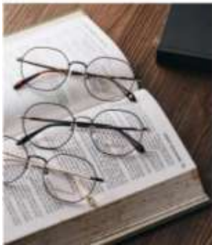
商品攝影-聚焦單一商品平視(搭配質感)