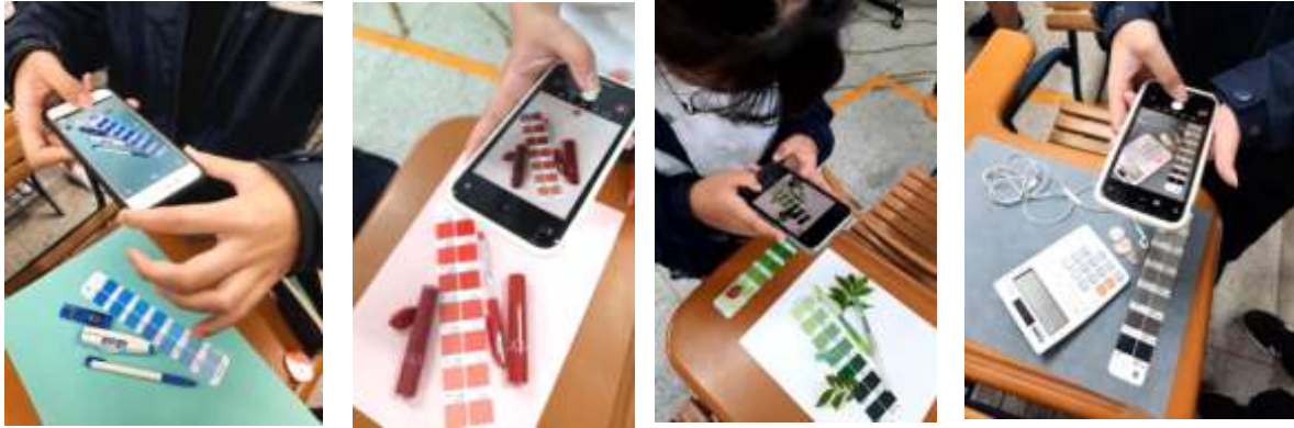
下課前利用LINECamera練習如何組圖