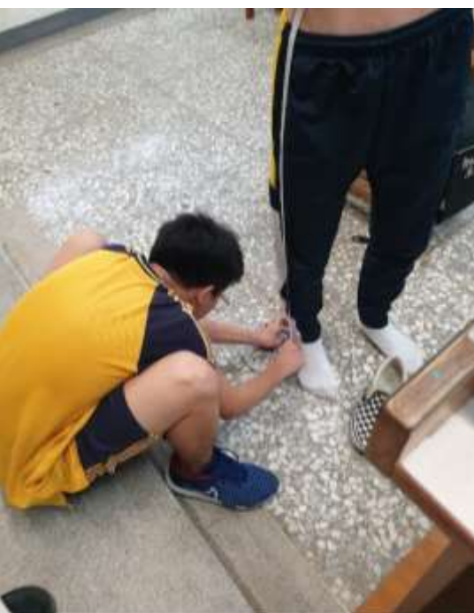
以布尺測量自己的身材列出數值