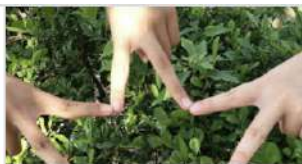
我與善化國中的關係.jpg