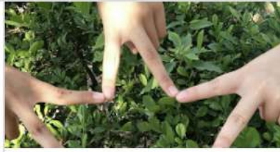
202 07 我與善中的關係.jpg