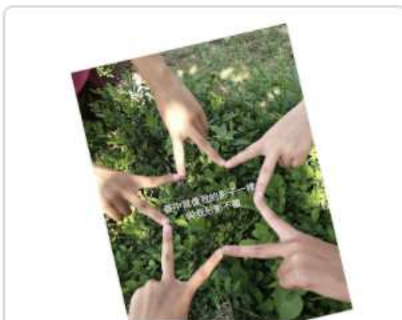
Collage 2020-10-14 10_4...