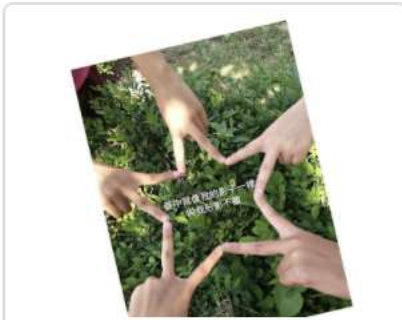
Collage 2020-10-14 10_4...