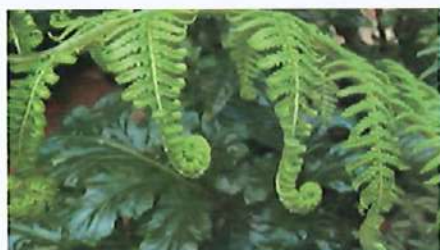
用的 PPT 資料

第二階段 讓學生由維特魯威人體圖，了解人體身材的黃金比例；並介紹中國傳統審美準繩，三庭五眼，探討臉型五官大小、比例、位置。引導學生發現活中的哪些物件，是師法自然，並暗藏黃金比例在其中的。讓學生提出生活中符合黃金比、黃金角或是數列的人造物設計，透過這些設計，是不是比其他沒有符合黃金比的設計更具美感呢？引發學生思考。