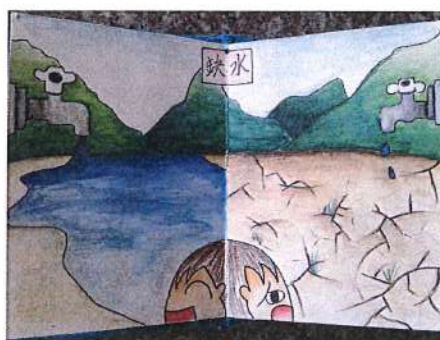
▲四位同學分別繪製之實事議題結合於布書內頁