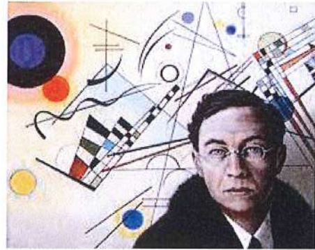
▲簡介康丁斯基藝術家的作品概念