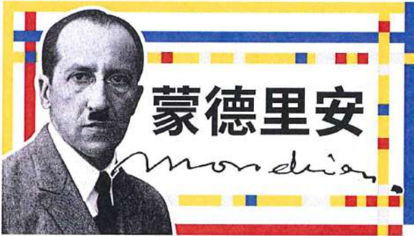
▲簡介蒙德里安藝術家的作品概念