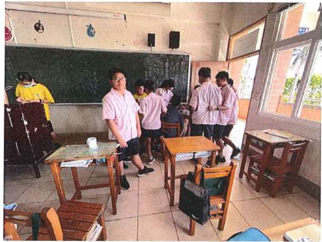
▲各別至教室前方與師長討論