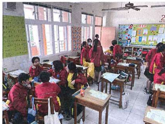
▲ 各個小組一同思考並製作書的封面