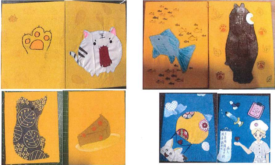
▲四位同學分別製作之布書衣