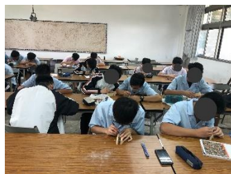
學生進行實作練習。