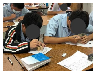
學生進行實作練習。