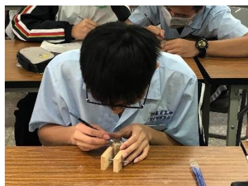
學生進行實作練習。