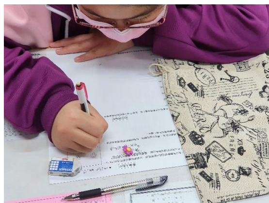
●將鈕扣從袋中拿出，以五官觀察記錄。