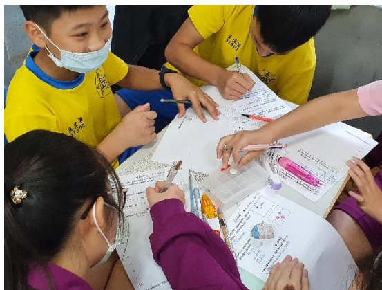
●觀察後，思考如何形容鈕扣質感。