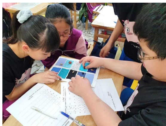
●思考鈕釦與布搭配各種可能性。