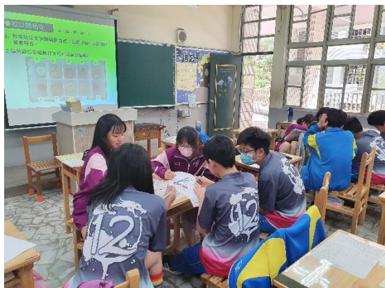
●分組質感探索活動。