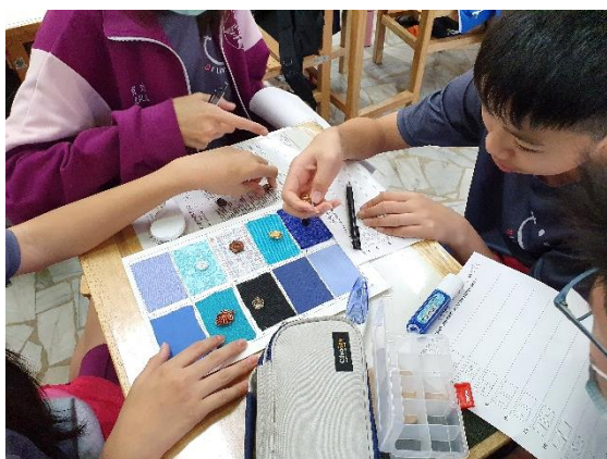
●鈕扣適合哪一片布呢？