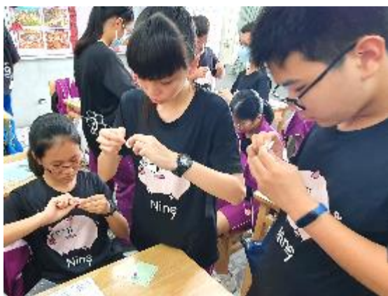
●以鈕扣與包紙細鐵絲製作鈕扣花。