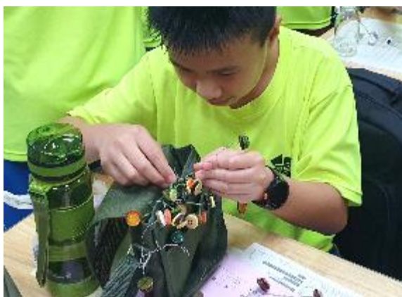
● 安排設計鈕扣花飾。