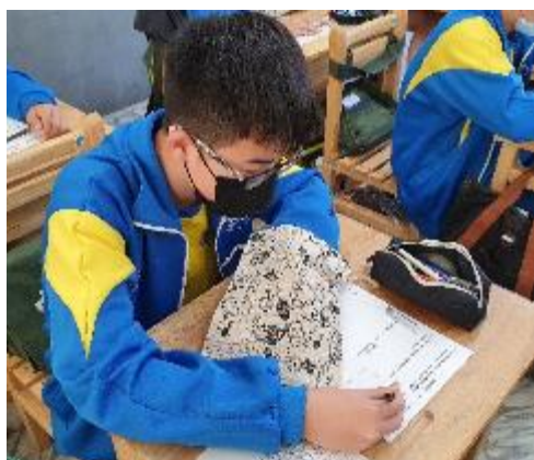
●以觸覺觀察袋中鈕扣質感。