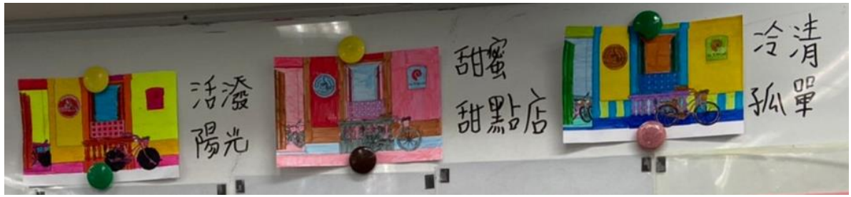
學生設計出來的店面風格，並根據配色說出店面給人的感覺