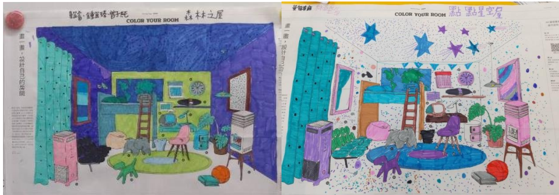
學生設計出的房間風格：森林之屋、點點星空屋