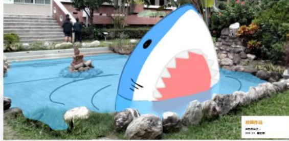
校園作品 2019.11. 鄭政諤