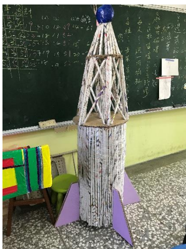
宇宙 3 號