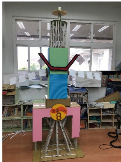
樂事 8 號