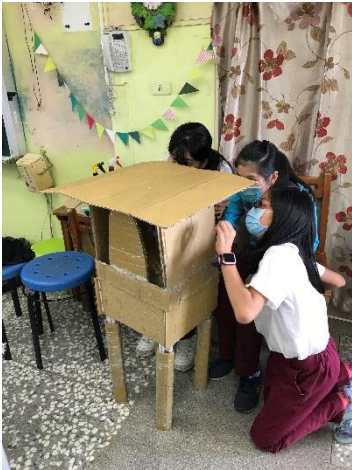
星光 7 號