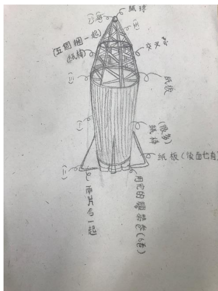
宇宙 3 號設計