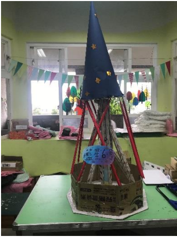
藍星 6 號