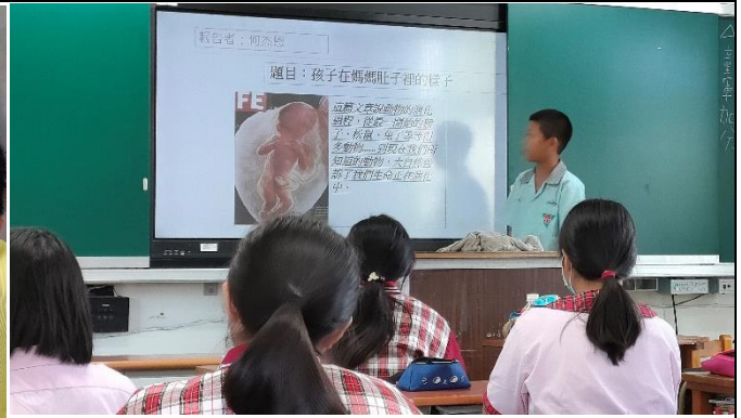
分組討論製作 ppt 上傳班級 classroom