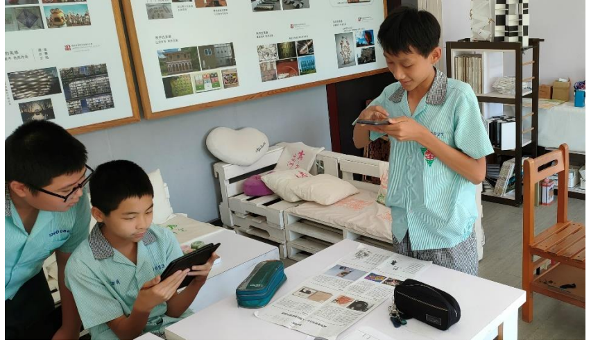
分組討論進行圖文蒐集