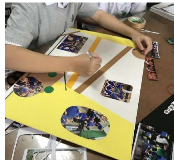
第四五節湖中攝影報導版面製作