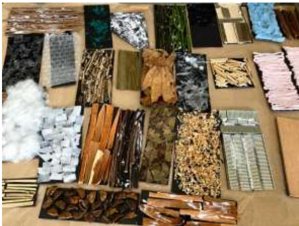
感拓印製作書腰前的質感體驗