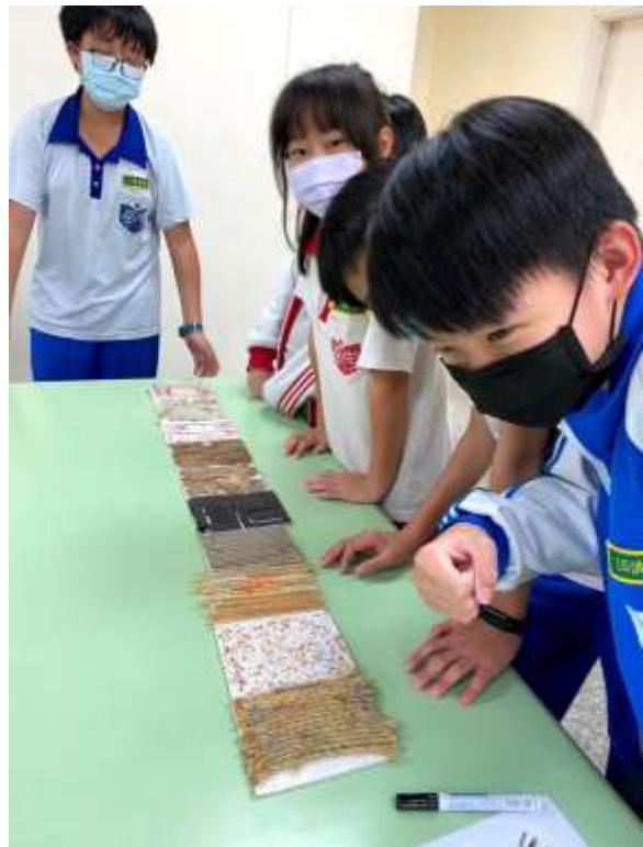
質感辨別產生排序的方式