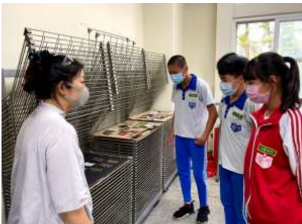
觀看質感片的製作比較出製作良好優美的 質感片使用的方式