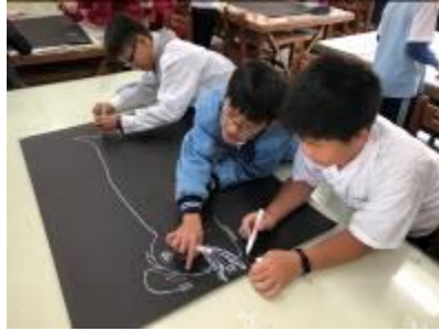
集體創作深海裡的神祕生物