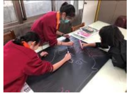
集體創作深海裡的神祕生物