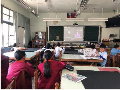
影片引導:美感智能閱讀-安 妮新聞