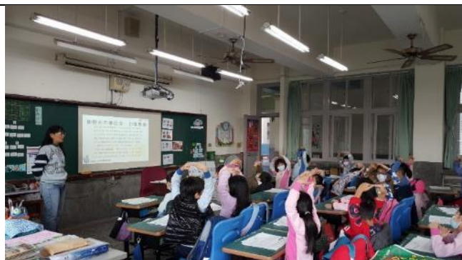
檢測閱讀理解，全班以手勢作答