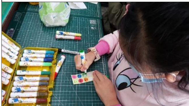
以貼紙、簽字筆製作專屬表情貼圖 emoji