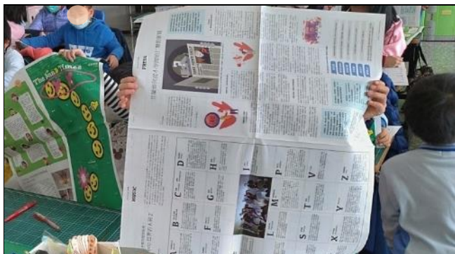
練習整理報紙，便於閱讀