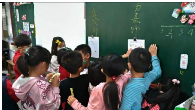
送給老師一張情緒貼