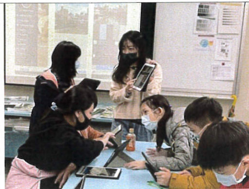
操作平板 app 製作色票