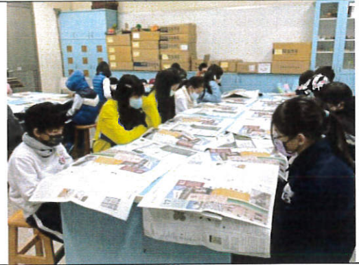
閱讀-現代建築大師柯比意 P4