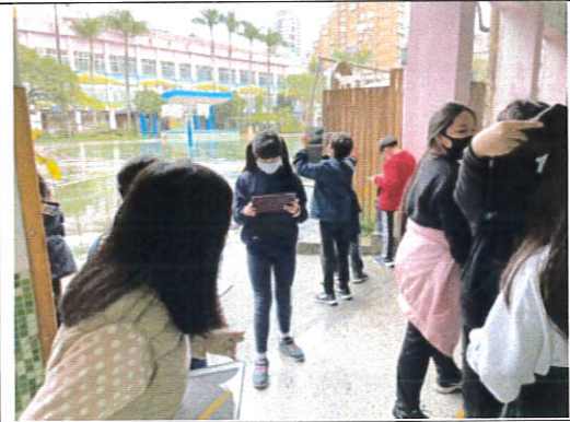
使用平板拍攝校園