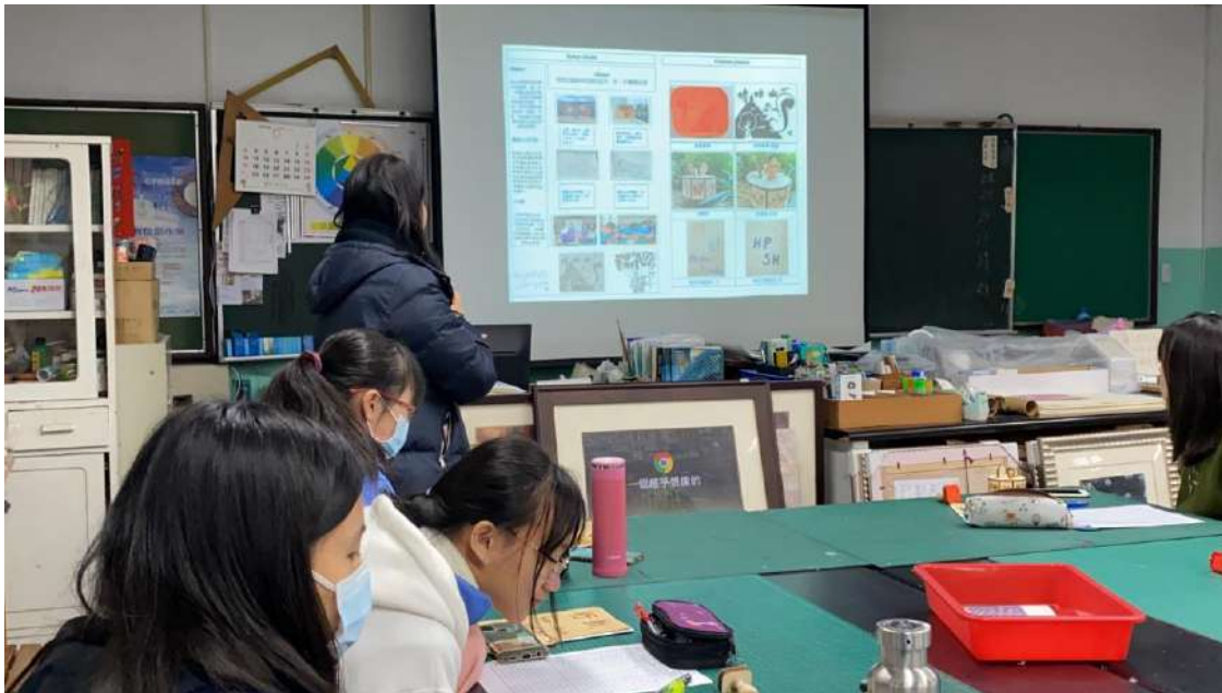
(上圖)個人報紙編輯成果分享