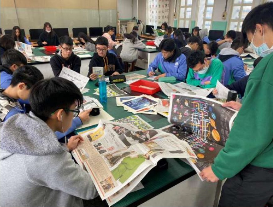
安妮新聞與自由時報 閱讀分析