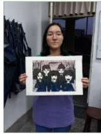
作者與作品的合照 我將貼近生活的「合唱」融入作品，當作元素

使用正確的器材，上墨時，必須思考顏料量是否太多，顏色符合作品等的因素，再來壓印時，注意器具的壓力是否適當，注意作品是否跑版。 總而言之，在做任何事情前，都必須思考清楚下一步該做什麼。 可以做出的調整：我可能會在顏色上使用暖色系的紅咖啡的顏色作為背景，讓人物和背景有強烈的差距。