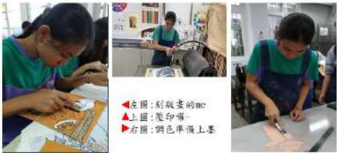
◀左圖:刻版畫的me ▲上圖:壓印囉~ ▶右圖:調色準備上墨

選用白色、黑色、皮褐色、深藍色，以冷色系為背景，加有溫度的皮褐色和鮮明的白色，既符合物品的顏色，又能凸顯主角。