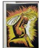
作品名稱:靜雨 作者:朱芳儀

作者透過自然的顏色、陰影以及輪廓勾勒出生動的圖像，也凸顯出主題--靜雨。我個人認為他的用色很好看，用自然環境的顏色，讓整個成品和諧又不失重點。從作品中可以看出作者的仔細小心，相比我頻頻失誤的印畫的作品，它的整齊也實在讓我打從心裡讚揚呢!