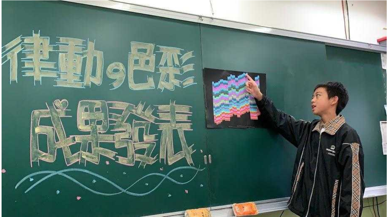
同學上台發表自己的作品 1