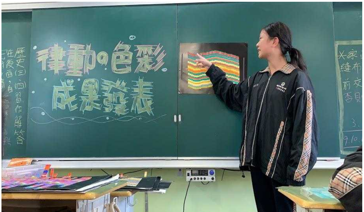
同學上台發表自己的作品 2