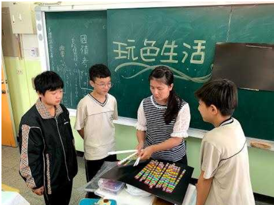
讓學生選底紙(有黑白兩色)