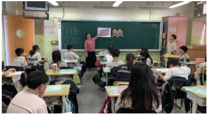
解說如何編排律動效果