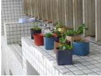
學生放在自己班上的作品 (2.0 版盆套)