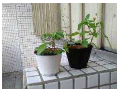
學生放在自己班上的作品 (舊款盆套)