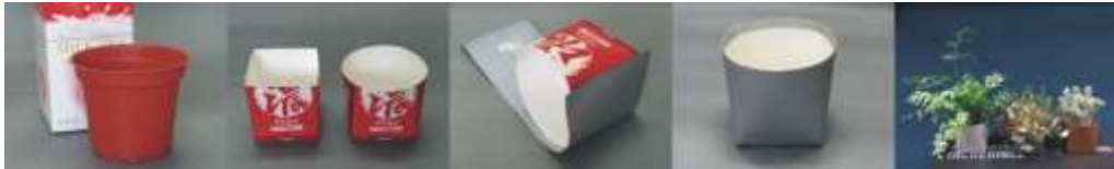
■ 2.0 版盆套製作方法