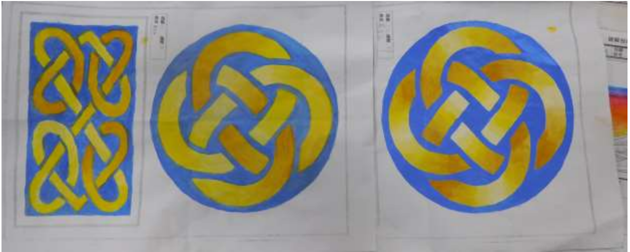
壓克力顏料著色平塗與漸層練習