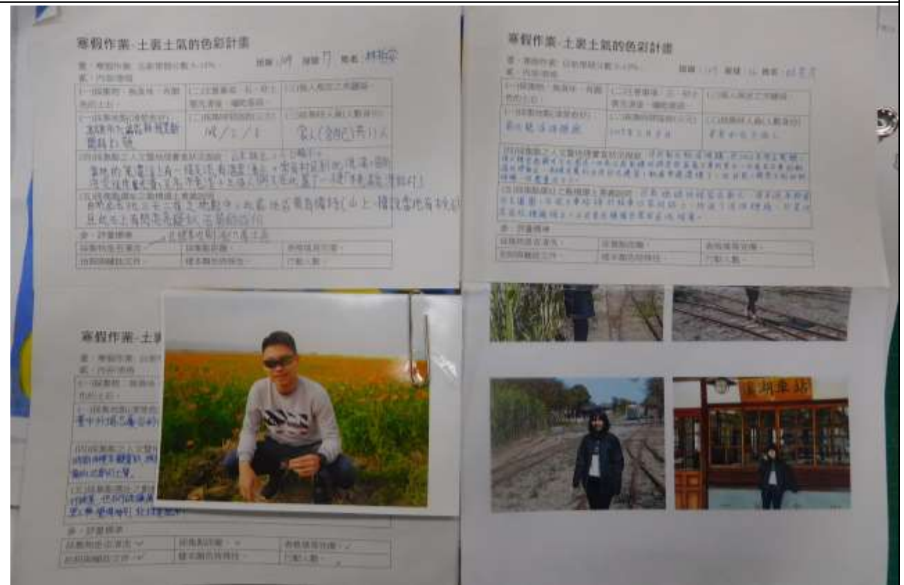
全台採土田野調查表製作