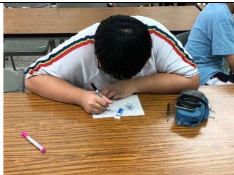
學生課堂文字練習