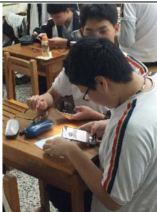
學生練習攝影 ( 微距 )