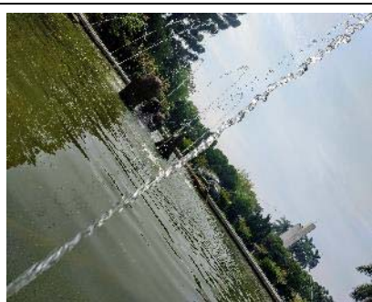
學生練習攝影作品 ( 對角線 )