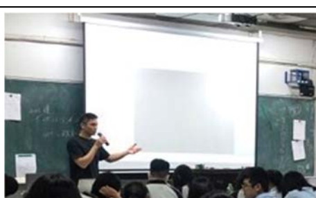
業界專業人士來校內演講