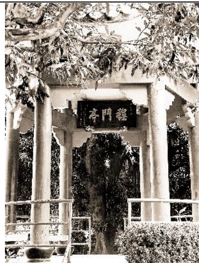
學生攝影作品 ( 練習使用手機軟體修改照片呈現效果 )