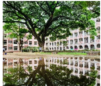
學生練習攝影作品（水平對稱）