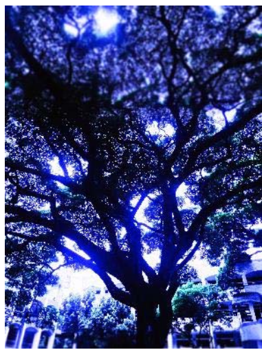
學生攝影作品 ( 練習使用手機軟體修改照片呈現效果 )