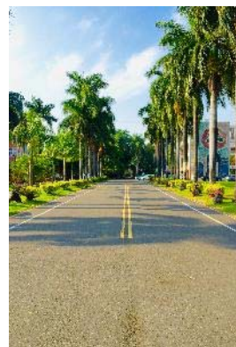
學生練習攝影作品 ( 一點透視 )