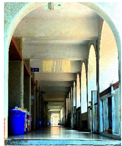
學生攝影作品 ( 練習使用手機軟體修改照片呈現效果 )