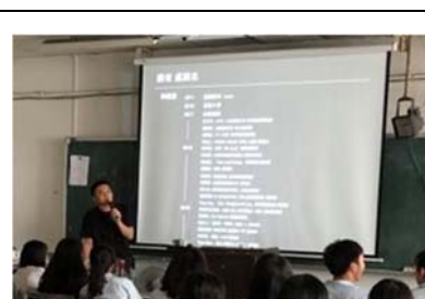
業界專業人士來校內演講