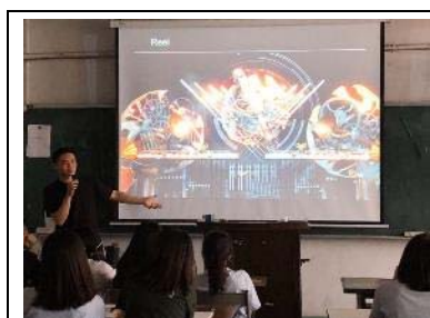
業界專業人士來校內演講