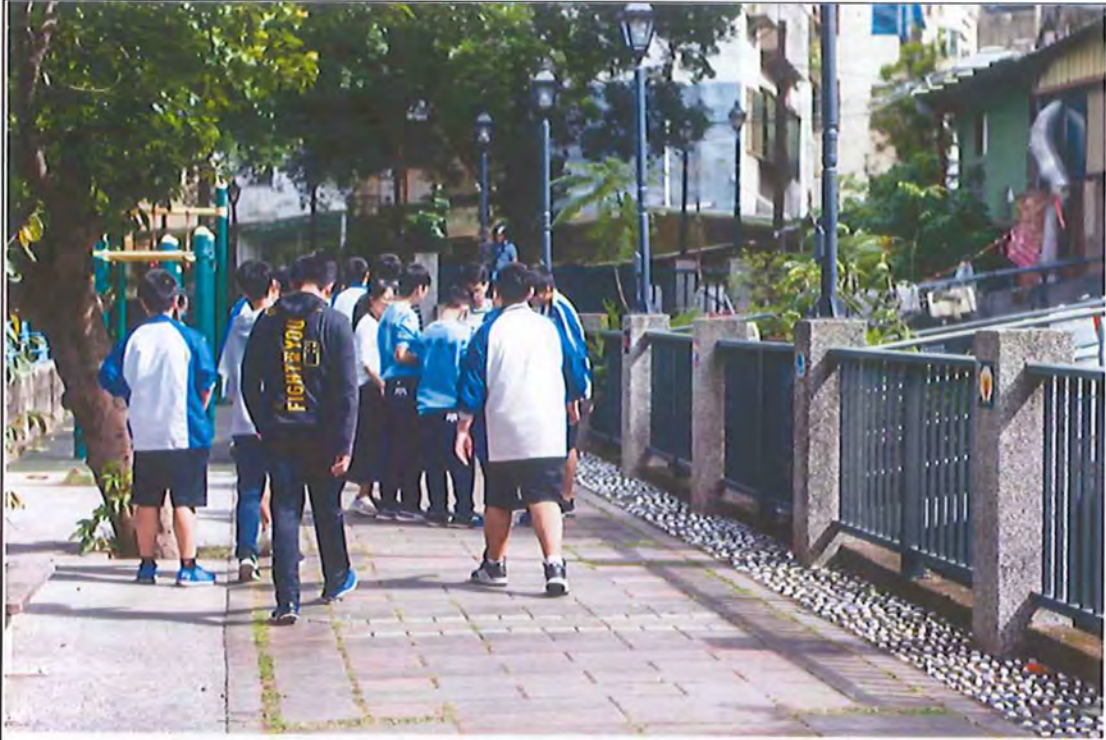
校區周遭汀甫圳的人文踏查，引導公民意識的議題討論