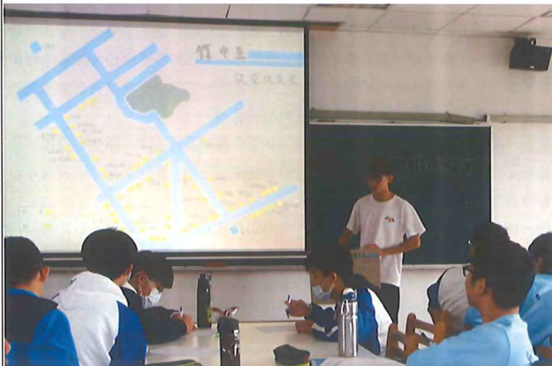
安排作品欣賞與分享，延伸地圖設計後帶來的思考