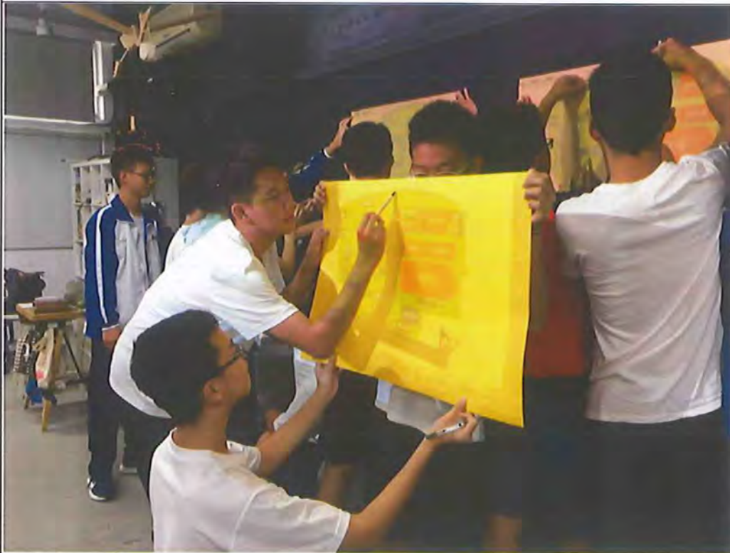
以竹中校園議題為主題地圖的表現對象，分組實作練習