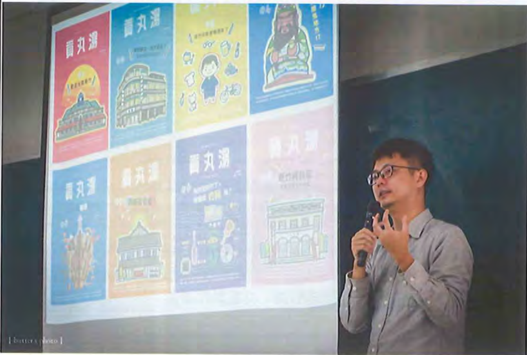
邀請新竹在地刊物「貢丸湯」雜誌主編演講關於議題形成與版面編輯