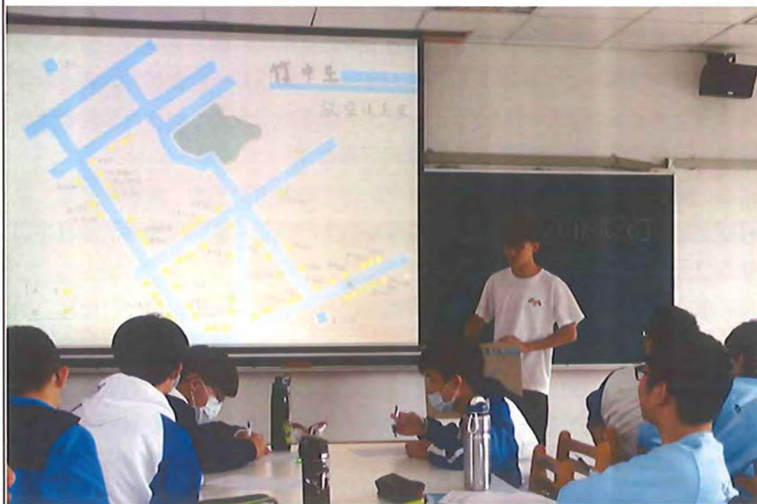
安排作品欣賞與分享，延伸地圖設計後帶來的思考