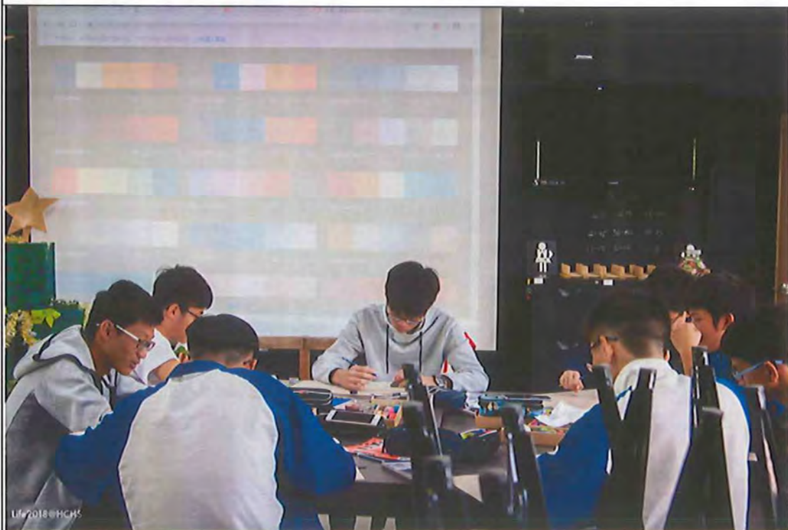
討論色彩協調與突顯的配置