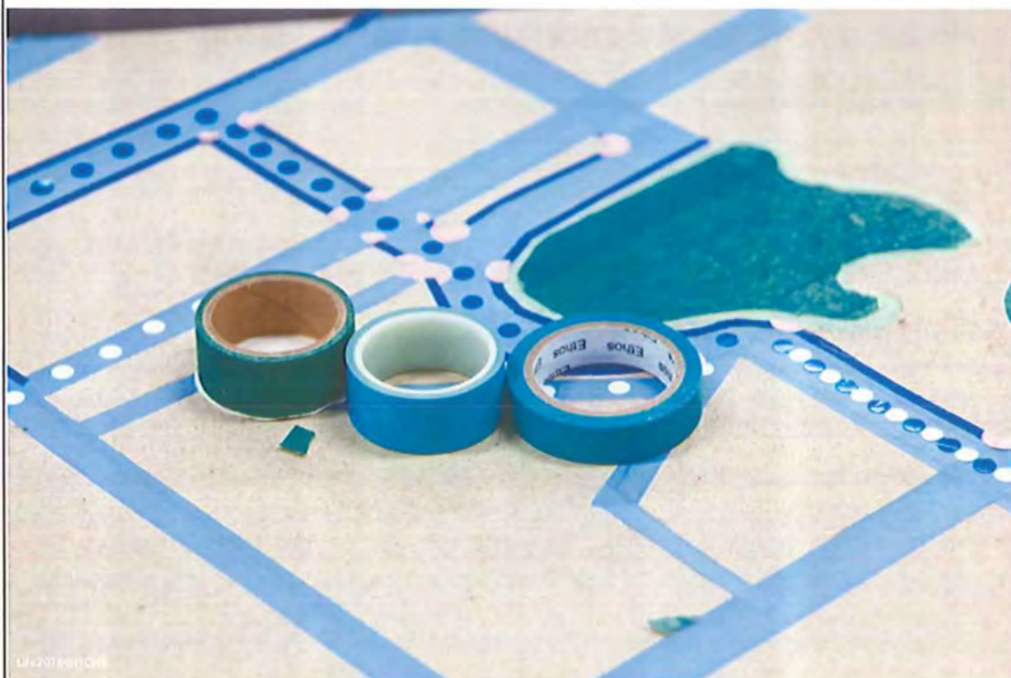
挑選合於表現的紙膠帶兩豆豆貼紙色彩組合