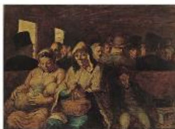
杜米埃 / 三級華爾 / 1863-1865 / 油畫 / 85.4*90.2cm / 美國紐約·大都會美術館