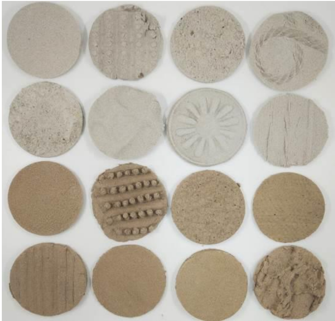
擬聲質感創作作品