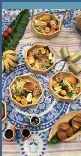
不用塑料，以天然素材為食器，質感渾然天成更具美感。

再怎麼回收，其實都抵不上生產的速度，何況，整個台灣也僅有兩間再生工廠，真正進入循環系統的，也只有毛織品角，其他的，只能被推入焚化爐，成為空汙，進入呼吸系統。