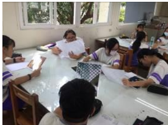
美感圖片討論分享並發表