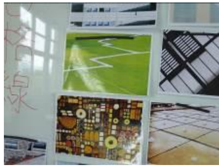
美感圖片討論分享並發表