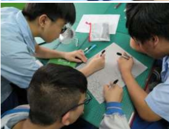
發揮小組合作學習精神來創作作品