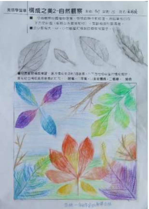
運用色鉛筆將編排好的樹葉和樹枝拓印於學習單上