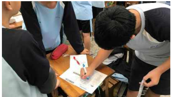
左圖：教師示範正確測量的方試