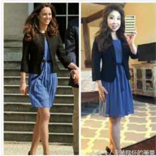
左上圖：分析搭配對身型比例的影響