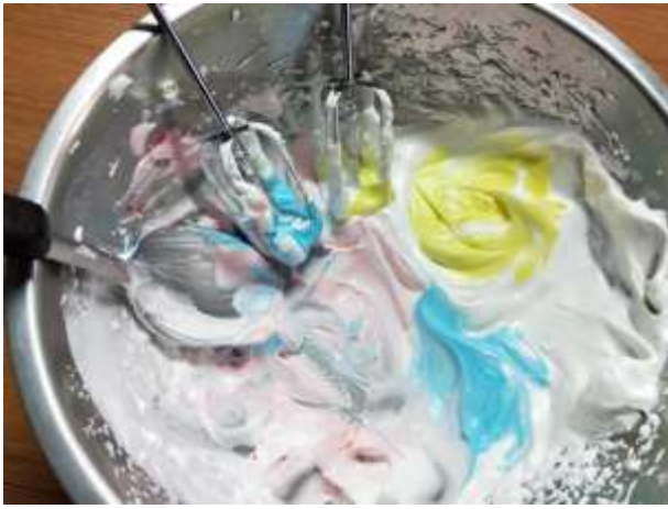
將鮮奶油打發，並加入色膏調色