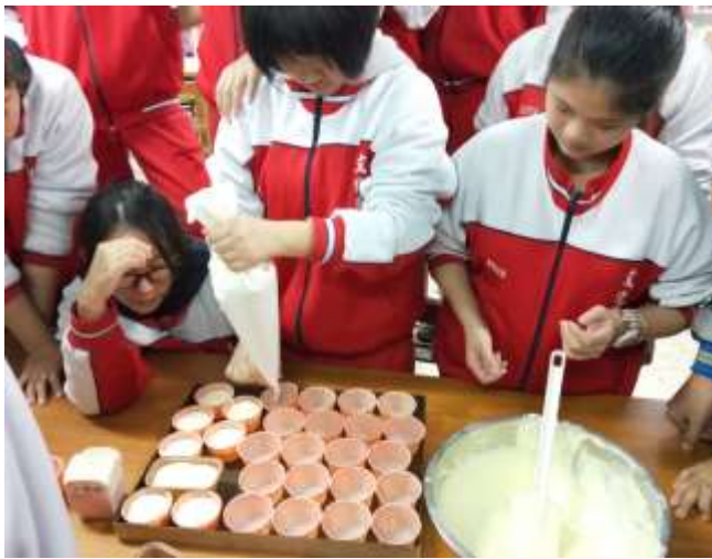
將麵糊注入杯子容器中