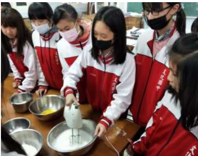
透過攪拌器攪拌蛋清，進行打發