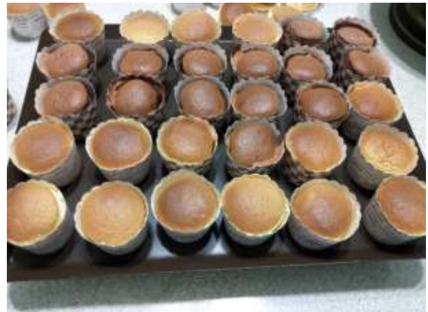
烘培後杯子蛋糕表面質感觀察