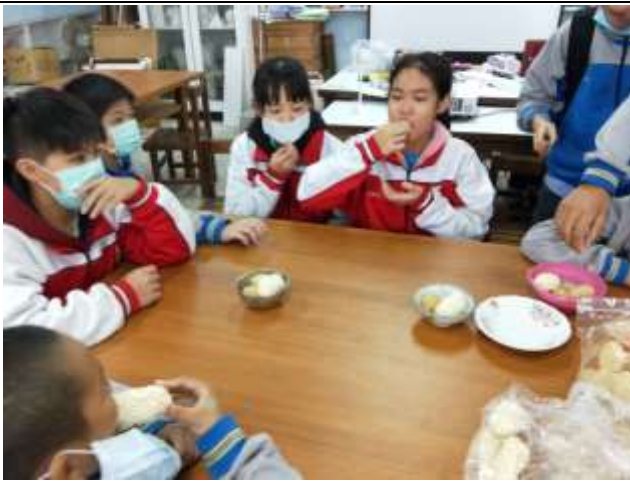
品嚐自己所搭配的食材其質感如何