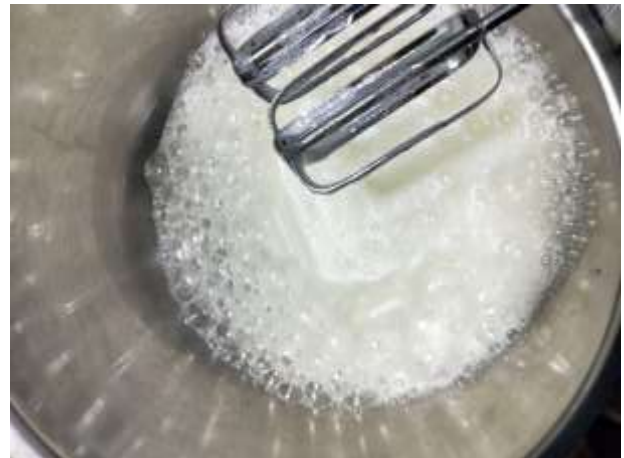
蛋清打發時所產生的質感