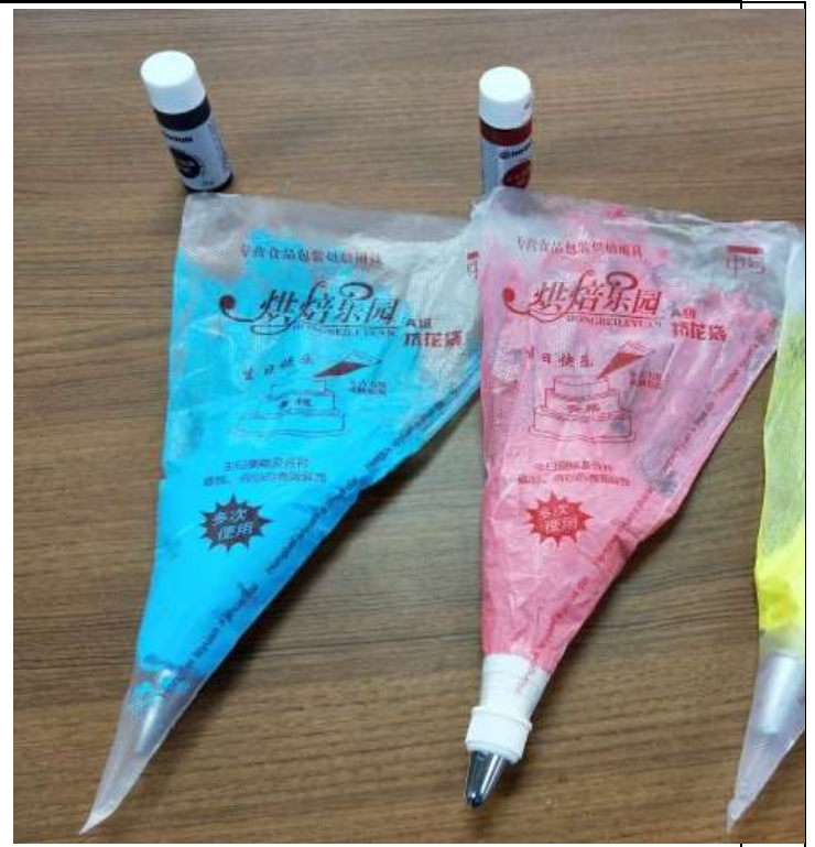
將調好色的鮮奶油置入擠花袋