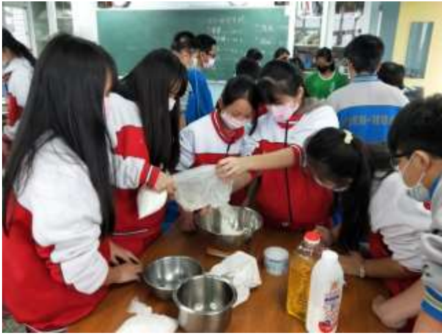
測量製作杯子蛋糕所需的材料