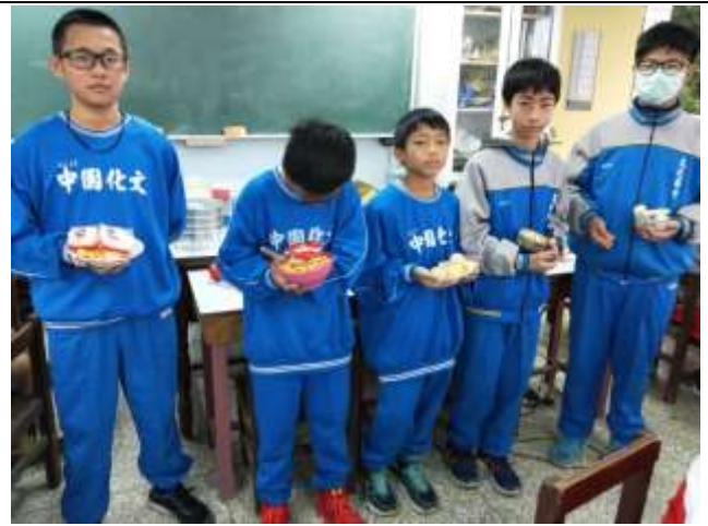
請學生報告為何選擇該容器與食材