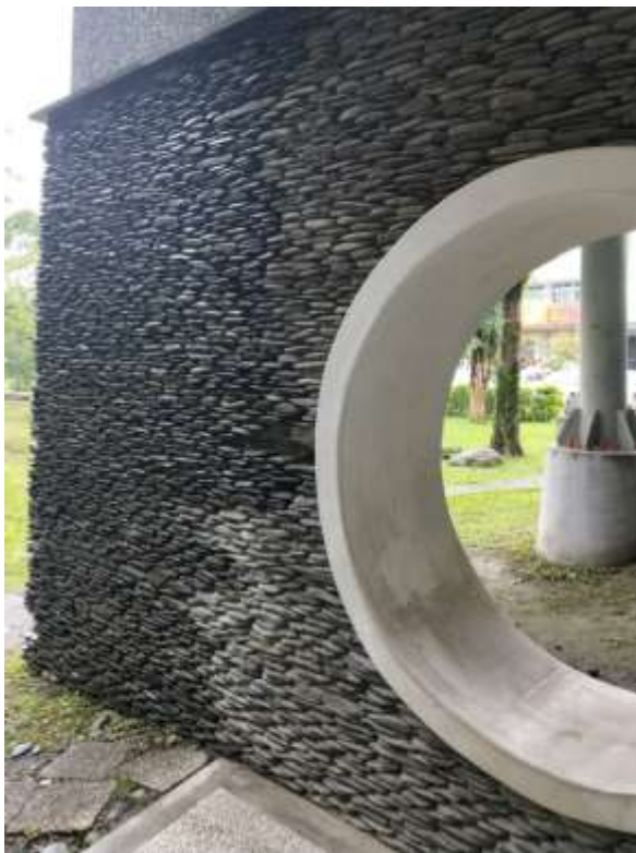
石板岩堆疊-粗糙厚重的質感