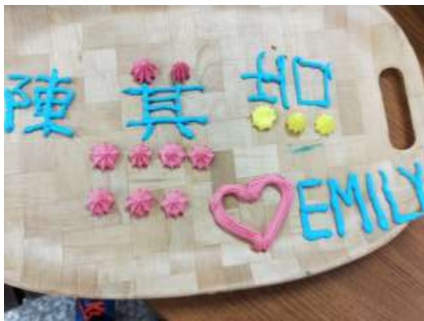
讓學生試著拉線條與擠花