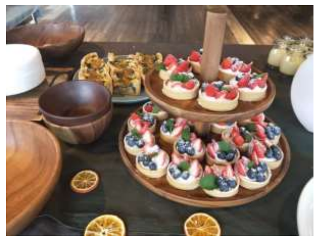
觀摩蛋糕裝飾後的質感呈現