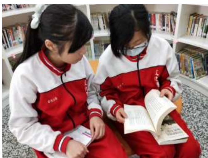
到圖書館選擇自己喜歡的書籍