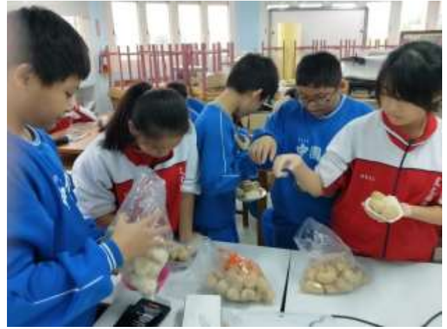
請學生選擇容器並搭配食材