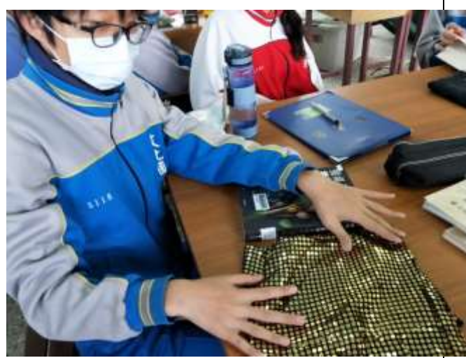
同學依書籍內容，找出合宜的布料