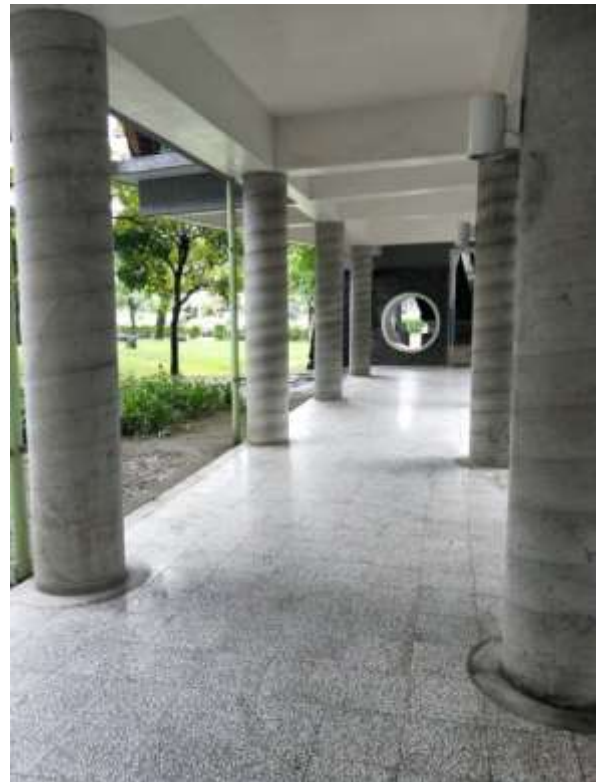
清水模廊柱-光滑細緻的質感