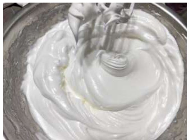
蛋清打發至濕性發泡的質感