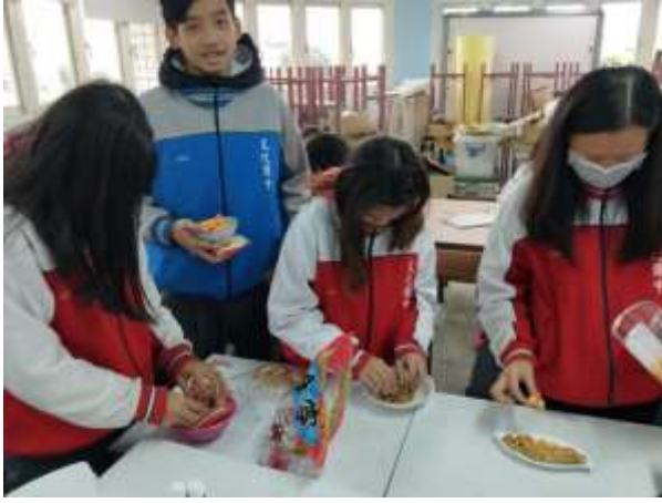
請學生選擇容器並搭配食材