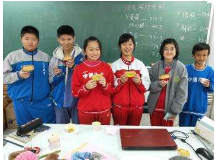
杯子蛋糕表面質感觀察