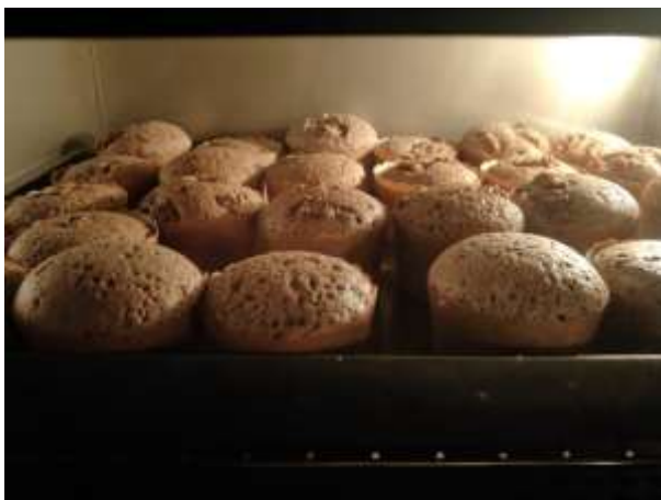
烘培中蛋糕膨脹的質感