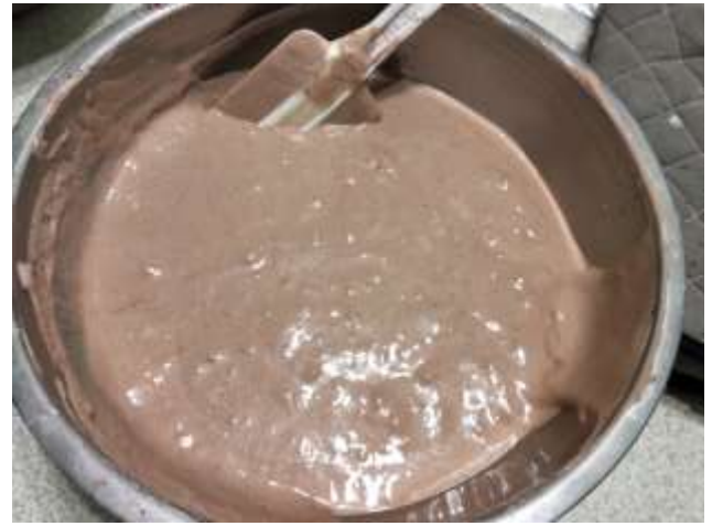
攪拌好的巧克力麵糊