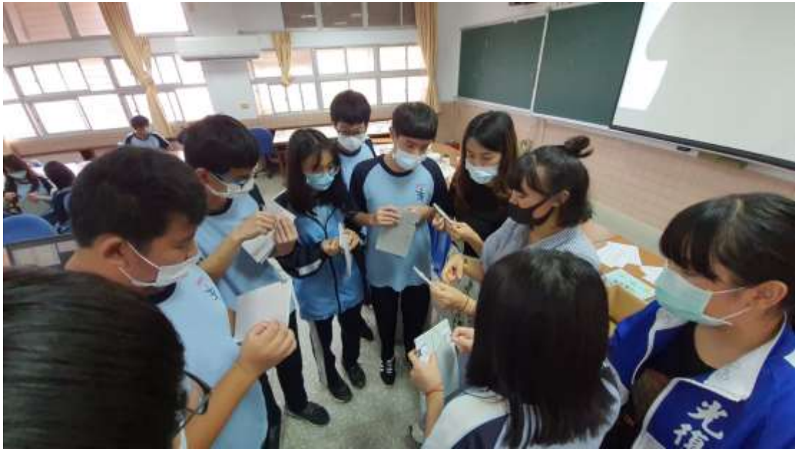
手抄紙線裝書 光復校外教學