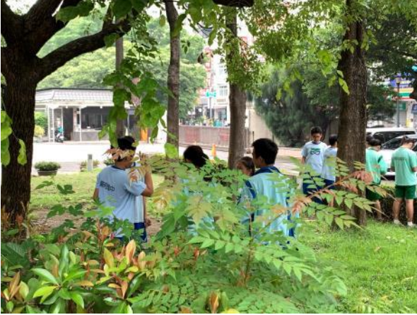
把他們帶到校園中，蒐尋校園色彩