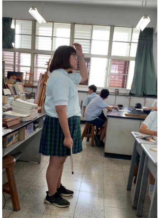
學生上台發表他的校徽設計理念