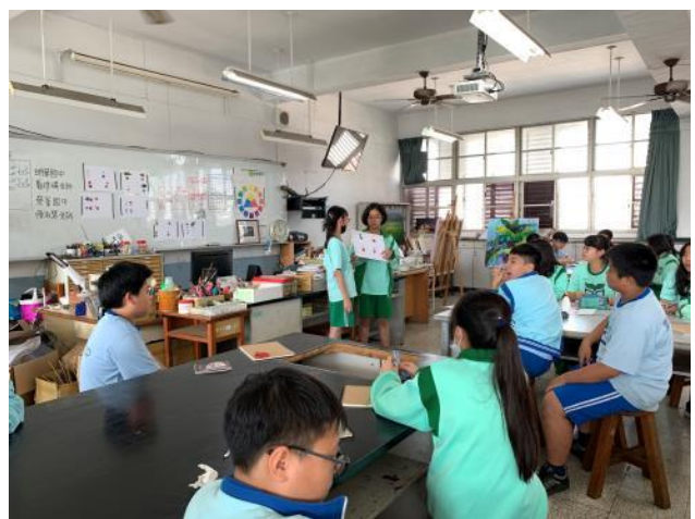
上台發表蒐集觀察結果