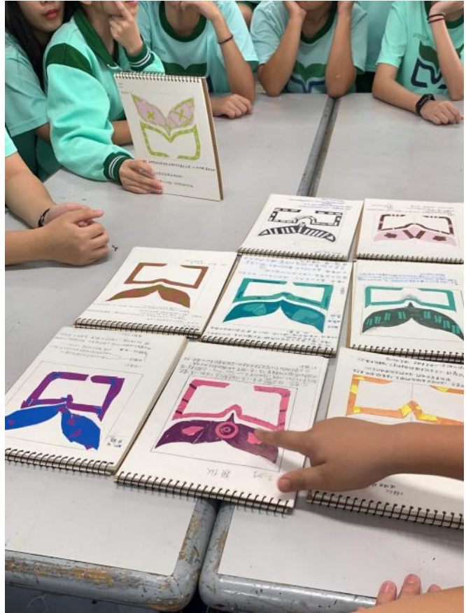
讓他們在製作方法、完成度方面彼此互相學習