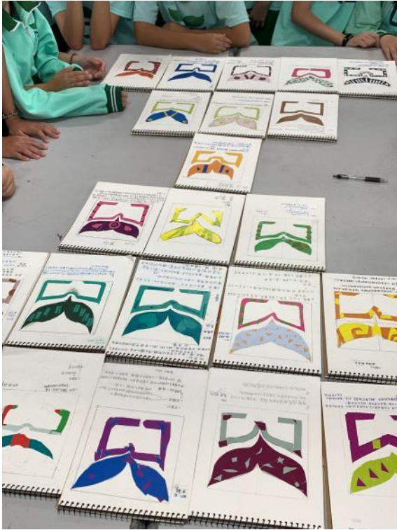
集合同學做作品觀摩