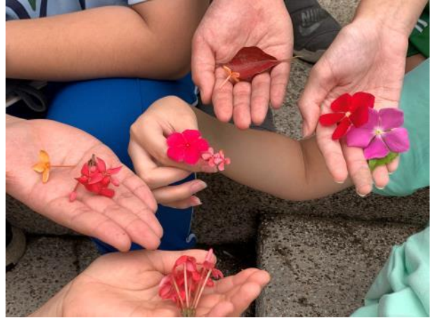
把他們帶到校園中，蒐尋校園色彩