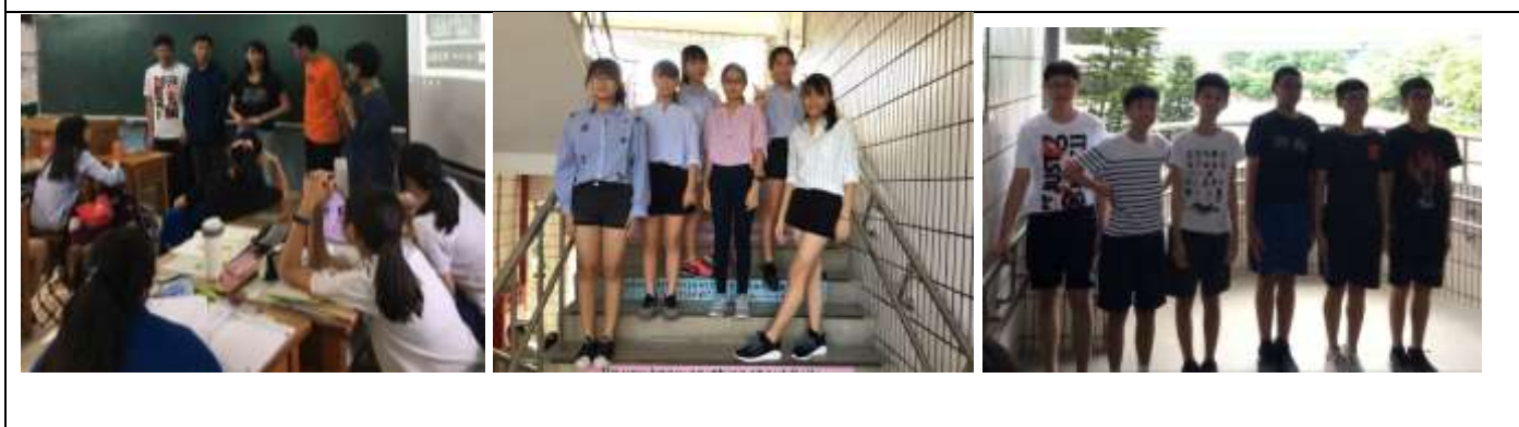
四.【色彩穿搭比例美】運用色彩表現穿搭比例美。