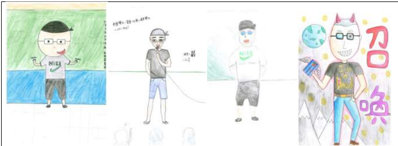
三.【調整身形大作戰】學生運用比例穿出服裝美感。