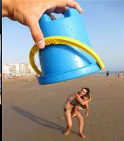
人物顯演的天較大人身顯比較小空間