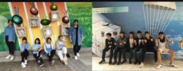
「置貼紙、圓筒空」天地空間合宜